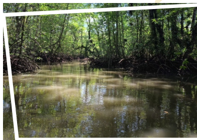
MODULO DE LA SALIDA