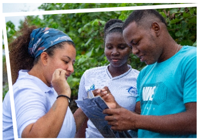
MODULO DE LA SALIDA